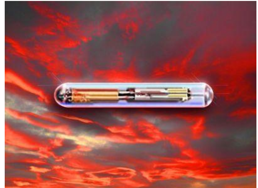
Der RFID-Chip - ein Zeichen und Wegweiser zur Hölle

Weitere Informationen auf der Website http://kath-zdw.ch/maria/schattenmacht/