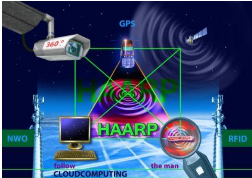
CloudComputing-RFID-Handy-Überwachung: Im Netz der NWO-Spinne

Weitere Informationen auf der Website http://kath-zdw.ch/maria/schattenmacht/